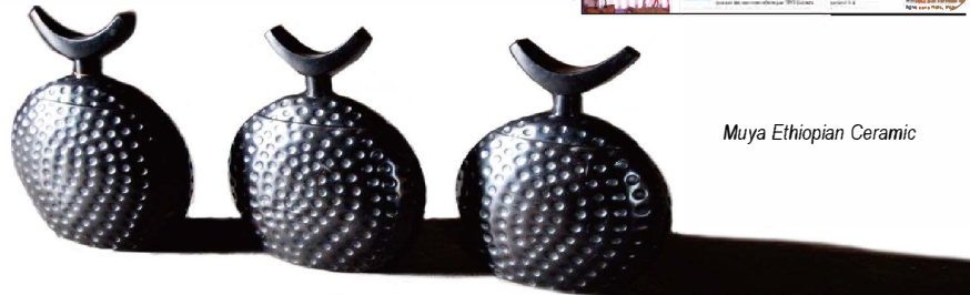
Muya Ethiopian Ceramic